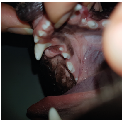
pacient 10. den po podávání Alavis Curenzym Podporující hojení