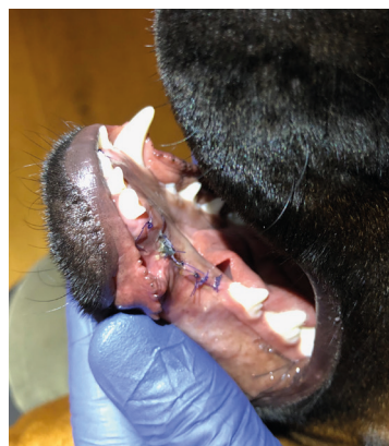
pacient 7. den po zákroku