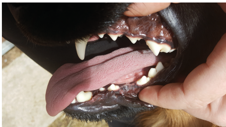
pacient 14. den po zákroku