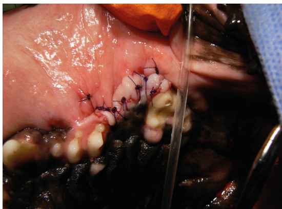
pacient v den zákroku