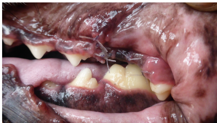
pacient 12. den po zákroku