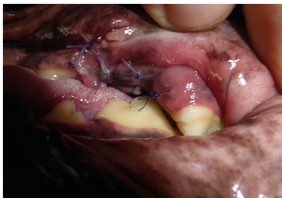
pacient 6. den po zákroku