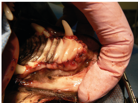
pacient v den zákroku