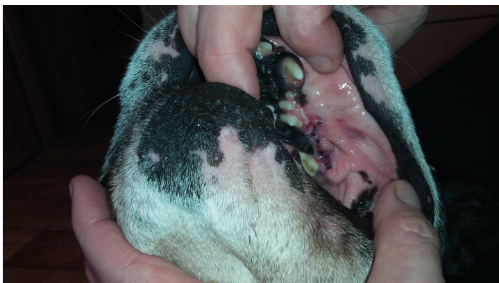
pacient 3. den po zákroku