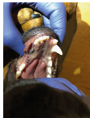
pacient 7. den po zákroku