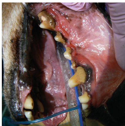
pacient - stav před ošetřením