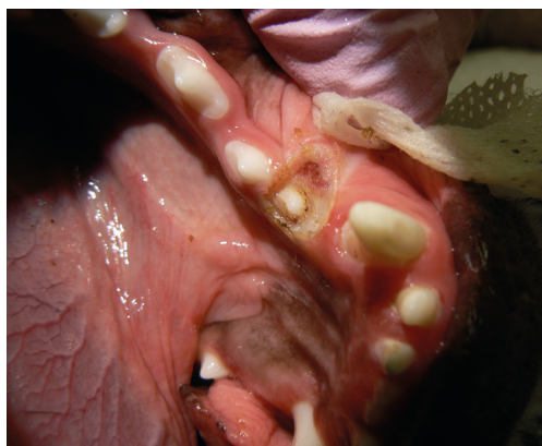
pacient v den zákroku

Pacient 7 - operkulektomie radiofrekvenční jednotkou