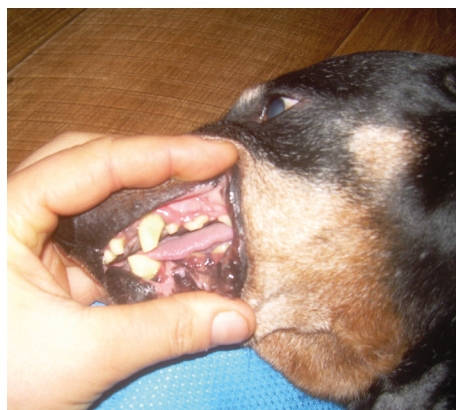
pacient 3. den po podávání Alavis Curenzym Podporující hojení