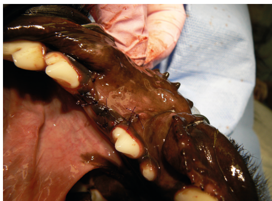
pacient v den zákroku