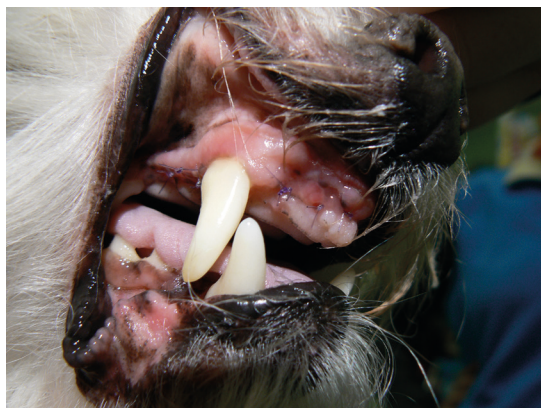
pacient 10. den po zákroku