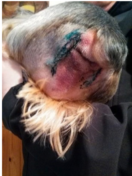
Obr. 2: Operační rána po 2 aplikacích (v intervalu 24h)