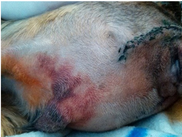
Obr. 1: Operační rána před ošetřením ALAVIS Hemagelem

MVDr. Lenka Řehořová Veterinární klinika Na Zdaboři - Příbram